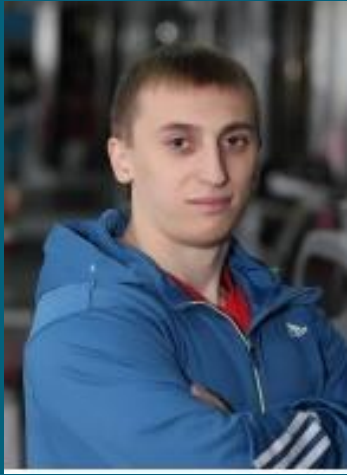
Антонюк Сергій МСМКУ з пауерліфтингу, чемпіон світу та рекордсмен Європи