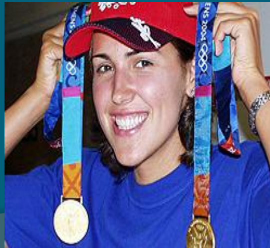
Клочкова Яна ЗМСУ з плавання, чотирьохразова олімпійська чемпіонка, призерка Олімпійських ігор