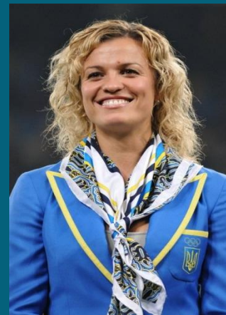
Добринська Наталія ЗМСУ з легкої атлетики, чемпіонка Олімпійських ігор, переможниця чемпіонату світу, призерка чемпіонату Європи