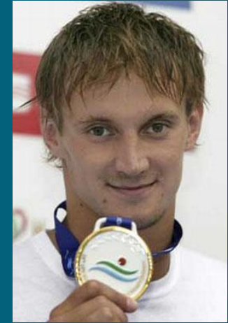
Бреус Сергій МСМКУ з плавання, учасник Олімпійських ігор, призер чемпіонатів світу, чемпіон Європи