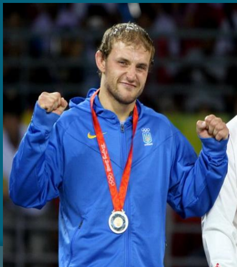
Данько Тарас ЗМСУ з вільної боротьби, призер Олімпійських ігор, призер чемпіонату світу, чемпіон Європи