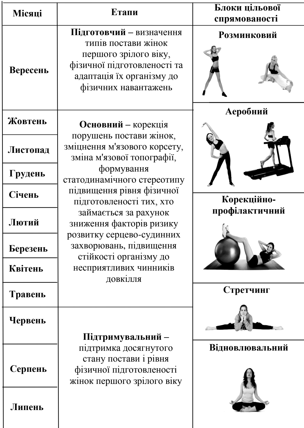
Рис. 2. Блок-схема технології корекції порушень постави жінок першого зрілого віку у процесі занять оздоровчим фітнесом