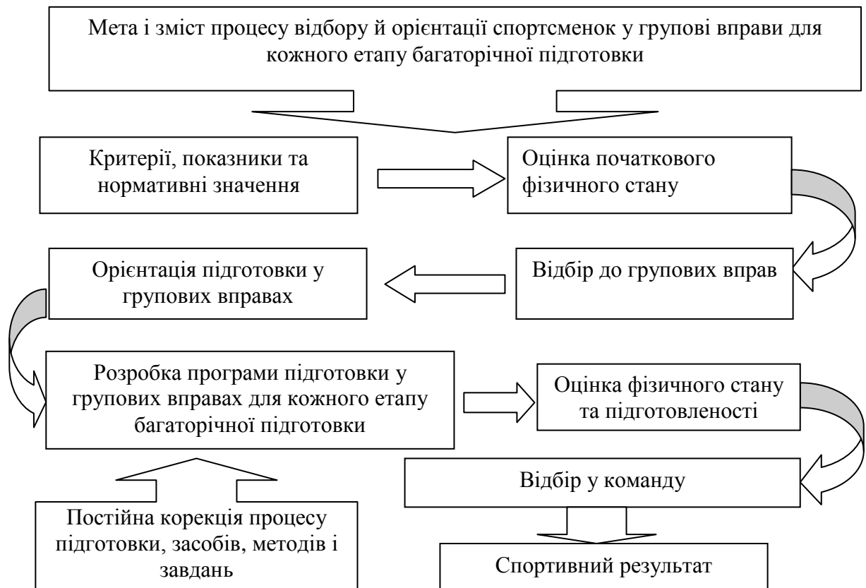
Рис. 2. Структурна схема технології відбору, орієнтації та підготовки спортсменок у групових вправах

операцій і процедур, що забезпечують досягнення прогнозованого результату, котру представлено у вигляді схеми (рис. 2).