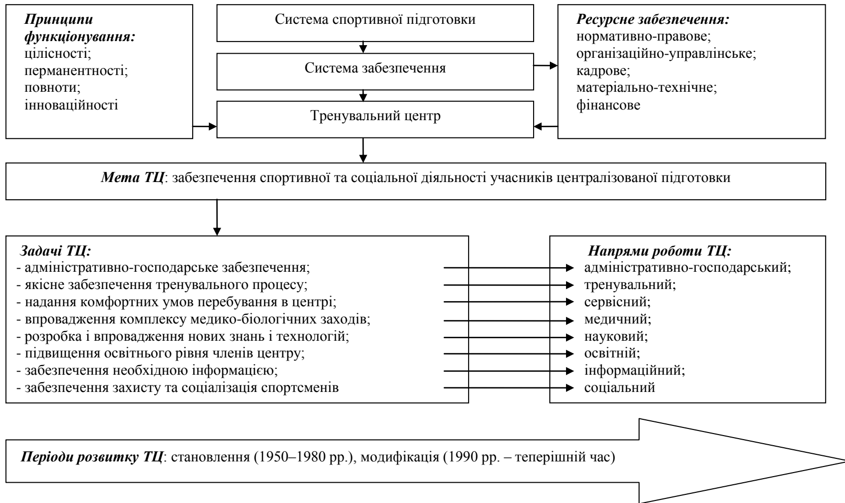
Рис. 1. Системна модель діяльності тренувального центру (ТЦ) олімпійської підготовки